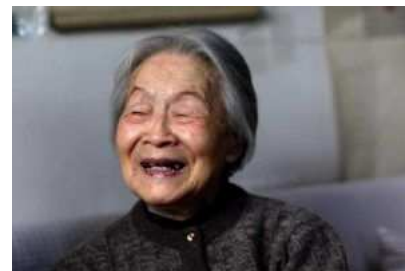
El Té del Olvido, Mengpo cha por Yang Jiang