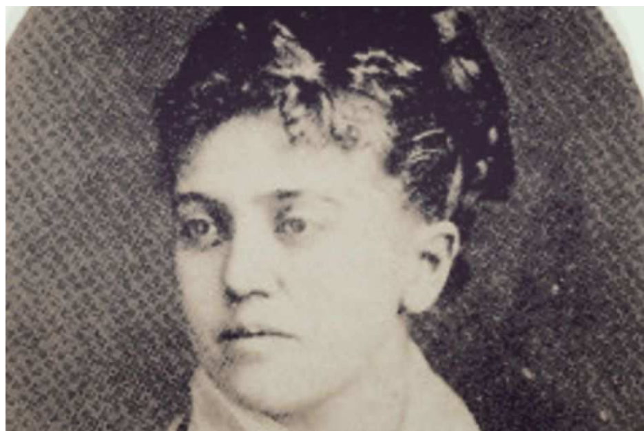
Rosario de Acuña conoció el éxito pero también sufrió diversas penurias

Las miradas de la capital glorifican, analizan, juzgan y denigran la majestuosidad de la figura del quinceañero que en menos de cinco semanas se convertirá en rey de pleno derecho. Alfonso XIII y la regenta María Cristina, rodeados de la más alta alcurnia aristocrática y política, apenas acaparan la atención durante unos minutos; han aparecido rivales dignos de admiración